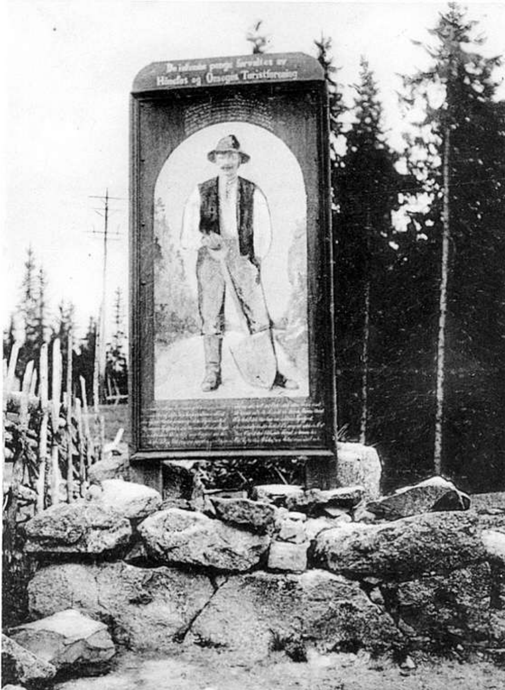
Kleivmannen. Eldre utgave.

Det har tidligere eksistert flere varianter av maleriet, og opprinnelig sto tavla nærmere husene på Kleivstua: