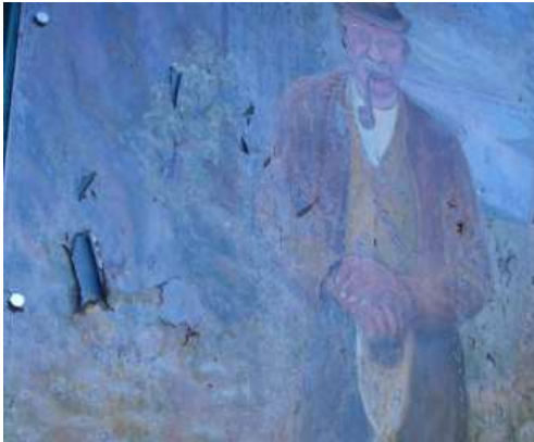
Malingskader på Kleivmannen høsten 2007.

med rette for igjen å utføre denne jobben igjen, og foreslo at man skulle ta kontakt med et reklamebyrå for å få en mer permanent løsning. Tavla ble tatt ned og bragt til Reklameservice A/S i Hønefoss. Her ble tavla fotografert og malingskader retusjert bort. Bildet ble så limt på en 2 mm tykk aluminiumsplate og forsynt med en beskyttende plastfolie. Den "Nye Kleivmannen" ble montert igjen påsken 2008. Stålplaten med den gamle Kleivmannen ble montert bak den nye aluminiumsplaten.