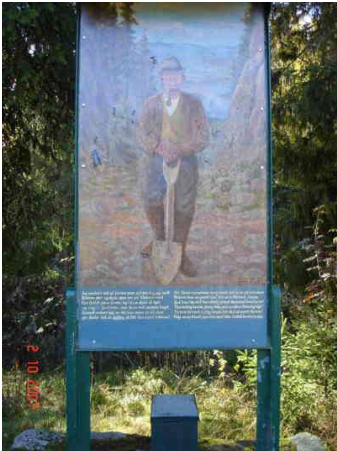
Kleivmannen høsten 2007.