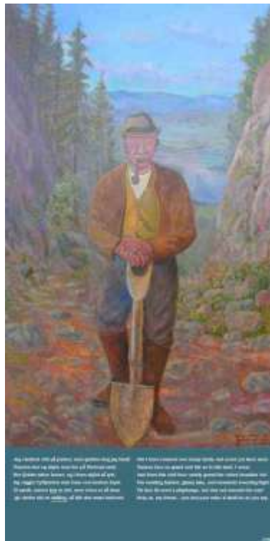
"Ny Kleivmann" påsken 2008.