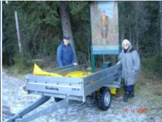
Demontering, transport og montering ved B. G. Harsson, A. Viktil og fotograf H. Viktil.