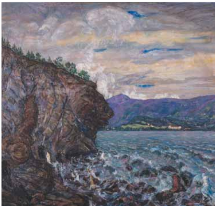
Eventyrstemning ved Tyrifjorden (1927). Oljemaleri, 69 x 72 cm. Har vært utstilt i Prins Eugens Waldemarsudde, Stockholm, 1973. Maleriet tilhører Sigrid Undsets hjem, Bjerkebak.