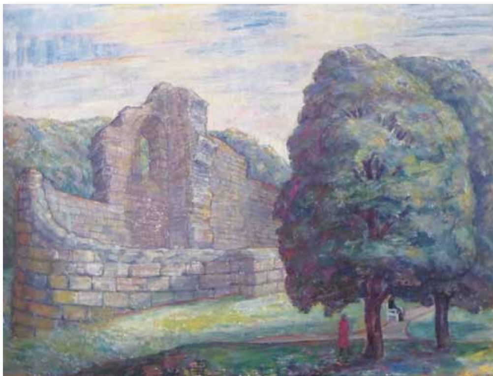
Ruinene på Stein gård (1932). Olje på lerret, 79 x 100 cm, signert og datert nede til høyre: A. C. Svarstad 1932. Bildet er ett av de fem motivene i frisen som hang i Apoteket Løven i Stabells gate, og har vært utstilt i Oslo Kunstforening, 1969, med tittelen Ringeriksfrisen I . I privat eie.