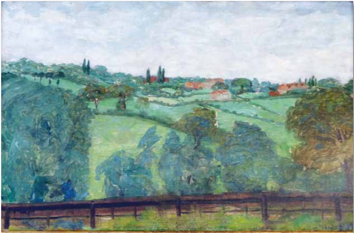
High Barnet (1912). Olje på lerret; 53 x 75,5 cm, signert nede til høyre: A. C. Svarstad. Bildet har vært utstilt i Kungliga Akademin, Stockholm, 1940, og minneutstillingen i Kunstnernes hus, Oslo, 1947. Eier: Hole historielag.

Anders Svarstad møtte Sigrid Undset i 1909 i Roma. Han søkte nå separasjon fra Ragna, og i 1912 giftet de seg i Antwerpen. De reiste kort etter til London, der de bodde et halvt års tid. Under dette oppholdet malte han en større komposisjon, Fabrikker ved Themsen , men han tok seg også tid til å male landskap, slik som High Barnet , en bydel nord i London.