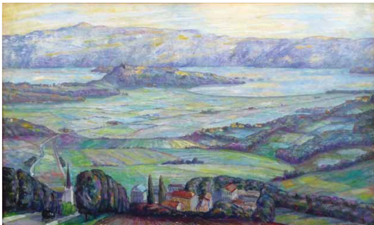
Ringerikslandskap med Norderhov kirke (1932). Olje på lerret, 80 x 130 cm, signert og datert nede til høyre: A. C. Svarstad 1932. Bildet er ett av de fem motivene i frisen i Apoteket Løven i Hønefoss. I privat eie.

Svarstad har stått ovenfor Tanberg og gjengitt det han ser med “kunstnerisk frihet”. Nederst til venstre gjenkjenner vi tårnet på Norderhov kirke, og husene i forgrunnen må vi tro er Tanberg, Ringvoll, Gusgården og Norderhov prestegård. I mellomgrunnen ser vi Steinssletta med Loreåsen som stikker ut i Steinsfjorden, og i bakgrunnen Krokskogen med den karakteristiske Gyrihaugen som høyeste punkt.