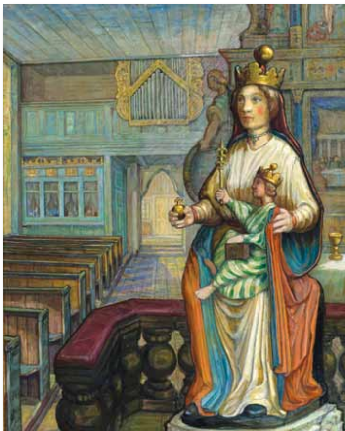
Bønsnesmadonnaen med interiør fra koret og inngangen (1924). Olje på lerret, 105 x 86 cm. Bildet har vært utstilt i Kristiania Kunstforening, 1924, og minneutstillingene i Kunstnernes Hus og Ringerikes Kunstforening, 1947. Tilhører Sigrid Undsets hjem, Bjerkebak.

Vi går inn i årets siste måned med et besøk i Bønsnes kirke, i Svarstads barndomstrakter. Trer en inn i kirkeskipet, ser en interiøret slik Svarstad gjorde det i 1924. Sammenligner vi madonnaen i Bønsnes med Svarstads madonna, ser vi noen interessante ulikheter. Ansiktstrekk, blick og hårfrisyre er helt forskjellig, og det synes som Svarstad har malt inn trekk av sin kone, Sigrid Undset.