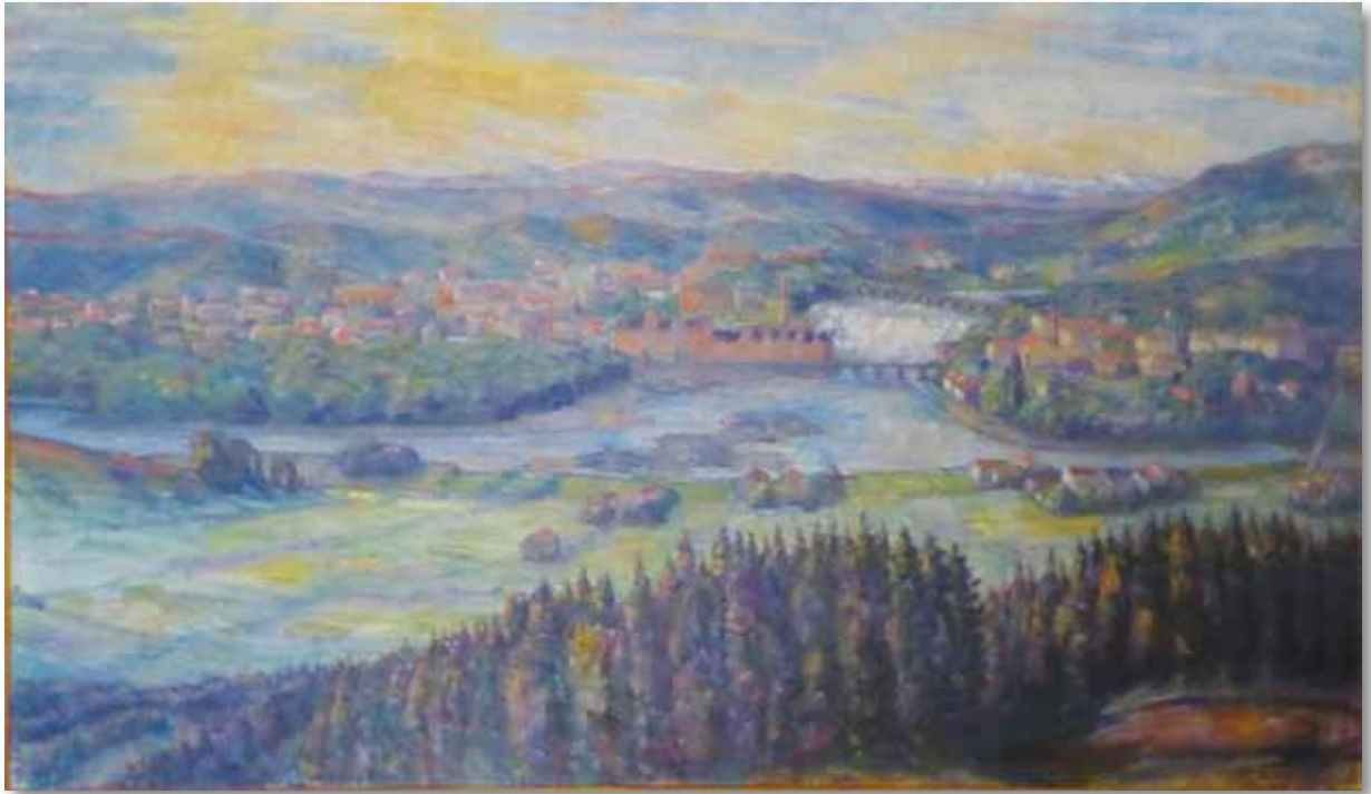
Hønen bro (1932). Olje på lerret, 81 x 136 cm, signert og datert nede til høyre: A. C. Svarstad 1932. Bildet er ett av de fem motivene i frisen som hang i Apoteket Løven i Stabells gate, og har vært utstilt i Oslo Kunstforening, 1969, med tittelen Ringeriksfrisen II . I privat eie.

Svarstad har stått på høydedraget på Vesterntangen og sett mot Hønefossen og byen. Han likte å male bylandskap hvor den moderne tid ble skildret. Industrimiljøer interesserte han: På nordsida rager den høye, kraftige skorsteinen til meieriet opp, og på sørsida er skorsteinspipa med fabrikkbygninger, verksted- og lagerbygninger på Hønefoss Brug godt synlig.