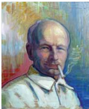
Selvportrett med sigar (1939). I privat eie.