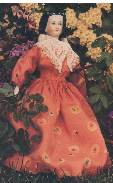
Dukken Beate, som Jørgen Moe forteller om i barneboka «I Brønden og i Kjærnet».