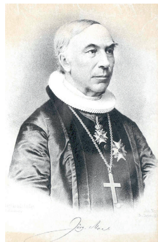
Jørgen Moe ble i 1876 utnevnt til biskop i Christiansands Stift (Agder), og hadde embetet til sin død i 1882.