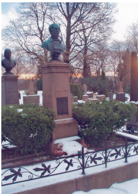
Gravstedet til Sophie og Jørgen Moe på Vestre Aker kirkegård i Oslo. Fire av deres barn er også gravlagt her.