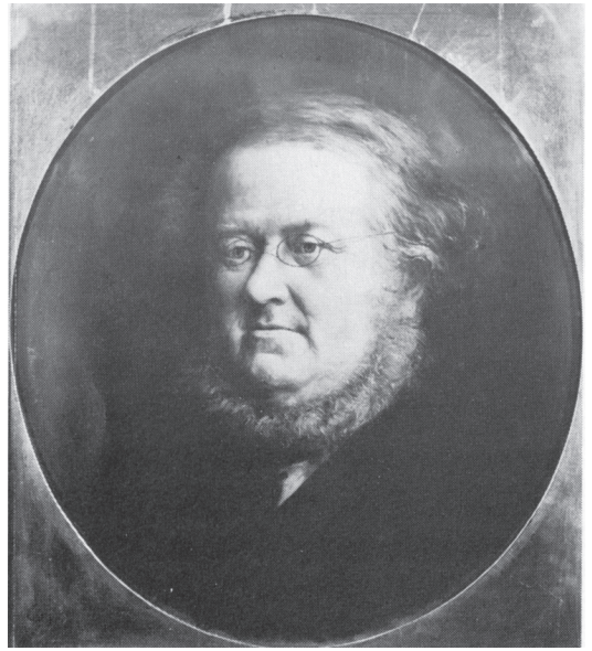
Peter Chr. Asbjørnsen (1812-1885), malt av Knud Bergslien. På nyåret i 1827 kom den 15 år gamle Asbjørnsen som elev til Støren-skolen på Norderhov prestegård, hvor den ett år yngre Jørgen Moe hadde begynt året før. De utviklet et livslangt vennskap.