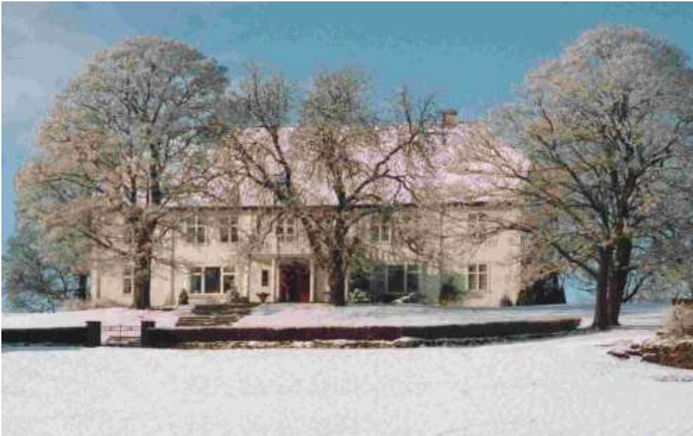
Hovedbygningen på Stein sett fra øst 1999