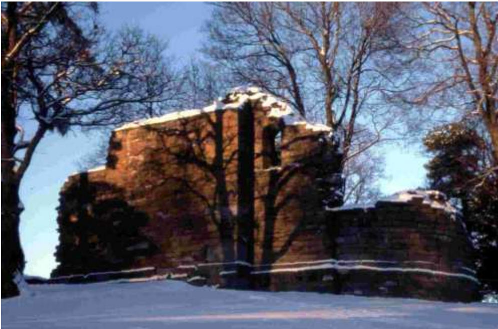
Kirkeruinen i vintersol 1999