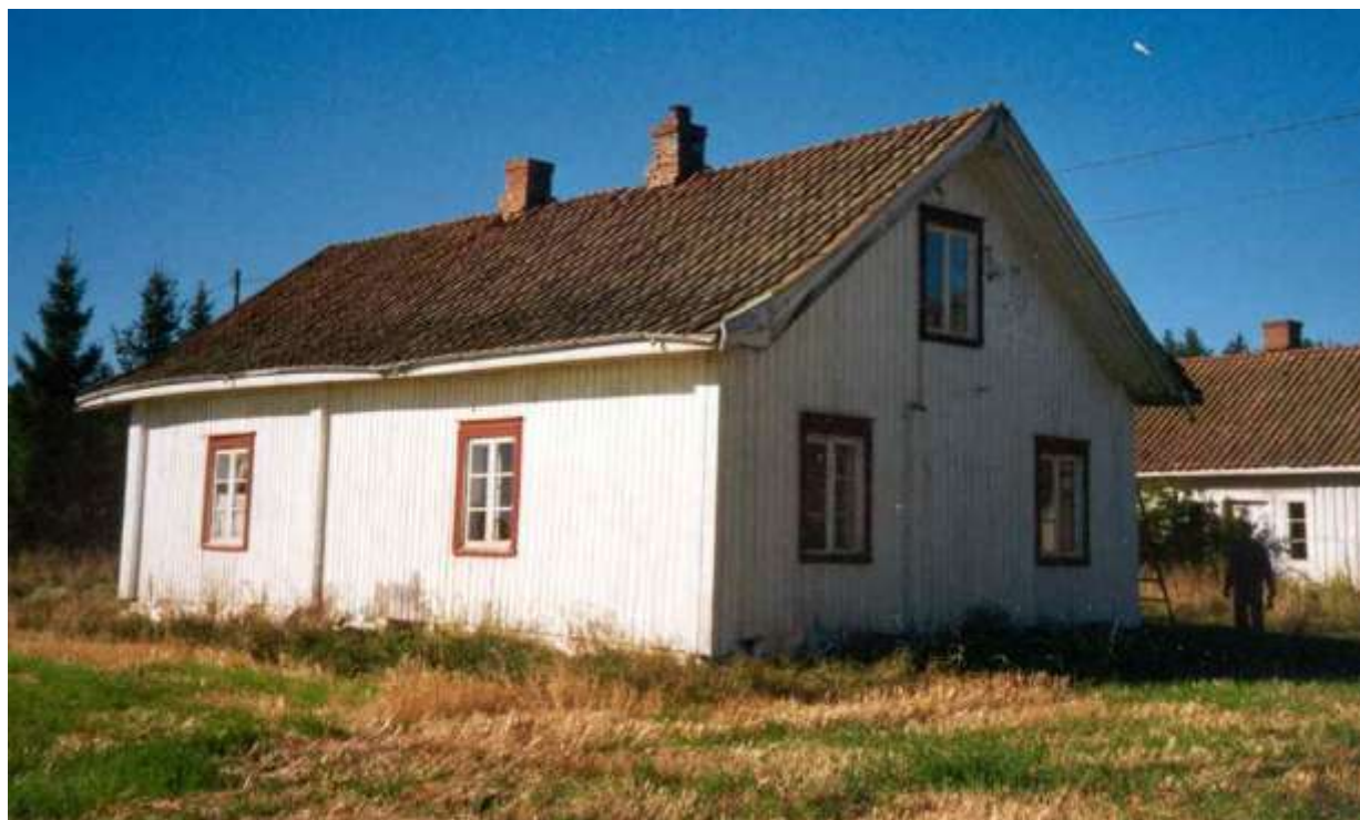
Søgården